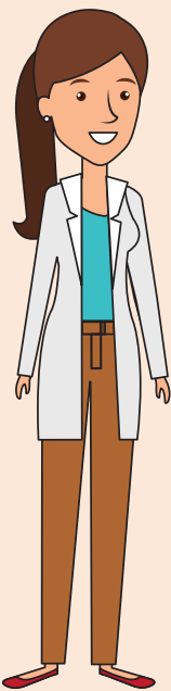
Nasrine Kinésithérapeute niveau 6E 3 ans d'ancienneté